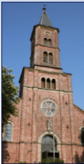
Kath. Kirche St. Dionys Oos Ooser Kirchstr. 1, Baden-Oos

Die Bibelgeschichten in Bildern mit Legematerial von Kindergartenkindern gestaltet. 19:30 / 20:30 Uhr: Die Bibelgeschichten werden vorgelesen mit den Bildern von den Kindern und musikalisch umrahmt (ca. 20 min). In den „Zwischenzeiten“ gibt es das Stille Angebot die Bibelgeschichten in Bildern sich selbst zu erschließen in besinnlicher Atmosphäre.