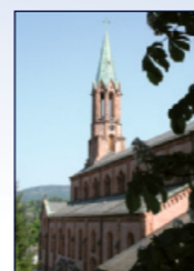
Kath. Kirche St. Bonifatius Kirchweg 7, Lichtental

18:30 Abendandacht mit den Beatles Lesungen und Musik für Viola da gamba vom Barock bis zu den Beatles