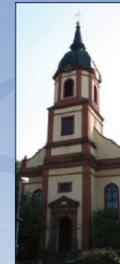
St. Bartholomäus Haueneberstein

18.00–20.45 Musik mit Stationen-Gottesdienst