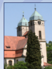
Evang. Lutherkirche Hauptstr. 51, Lichtental

Der Methodismus wurde aus dem Lied geboren