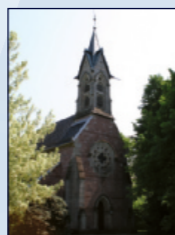
Evang.-luth. Johanniskirche Bertholdstr. 5, Stadtmitte

20.00 Eintauchen in die lichtvolle Atmosphäre des Taizé-Gebets (ca. 45 min.)