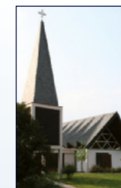
Evang. Matthäuskirche Steinbacher Str. 10, Steinbach

20:00 Bibelworte – Stille – gute Gedanken