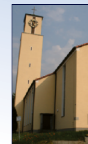
Kath. Herz-Jesu Kirche Am Kirchberg 7, Varnhalt