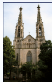
Evang. Stadtkirche Augustaplatz, Innenstadt

18:30 Klänge zum Ankommen und Verweilen Ausgewählte Bilder a. d. Tübinger Bibel v. Sieger Köder