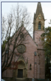
Kath. Dreieichenkapelle Rheinstr. 64, Weststadt