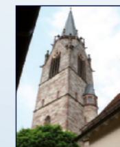
Kath. Kirche St. Jakobus Häfnergasse 16, Steinbach

20:00 Bibelworte – Stille – gute Gedanken