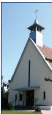
Evang. Friedensgemeinde Schwarzwaldstr. 131, Baden-Oos

18.00 Musikalische Lesung/Buchvorstellung: „Mut im Gepäck“ vom Gehen und Ankommen, „Dieser Ort öffnete meine Seele“