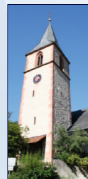
Kath. Kirche St. Antonius Ebersteinburger Str. 52, Ebersteinburg

Öffnen Sie die Türen für die Kraft moderner geistlicher und weltlicher Musik, interpretiert durch die Jugend-Kirchenband „Spielraum“, Eröffnen Sie „Gedanken-Spielräume“, bei ergänzenden Impulsen und Texten des Gemeindeteams St. Antonius. Entdecken Sie danach bei einer selbstgeführten Kirchentour die historischen und modernen Kunstschätze unserer Kirche (Smartphone empfohlen aber nicht zwingend erforderlich)