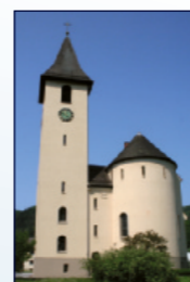
Kath. Kirche Heilig Geist Bushaltestelle Heschmattweg, Geroldsau

Das Angebot ist besonders auch für Familien geeignet