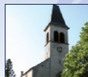
Kath. Kirche St. Eucharius, Balger Hauptstr. 57a, Balg

18:30 Klänge zum Ankommen und Verweilen Ausgewählte Bilder a. d. Tübinger Bibel v. Sieger Köder