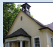
Evang.-methodistische Christuskapelle Lichtentaler Str. 77a, Eingang Hahnhofstr., Innenstadt

19:30 Impressionen aus Geschichte und Gegenwart