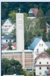
Evang. Pauluskirche Jagdhausstr. 18, Weststadt